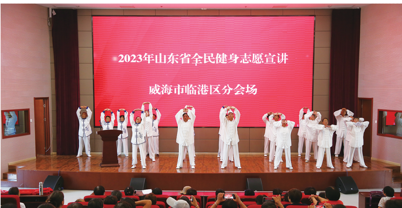
太极拳爱好者进行展演。

宣讲结束以后,很多学员兴致不减,纷纷围绕在培训老师身边请教,还有不少希望老师能够提供教学视频,回去坚持练习。临港区老年人体育协会有关负责人表示,9月份以后,每周会举办一次公益