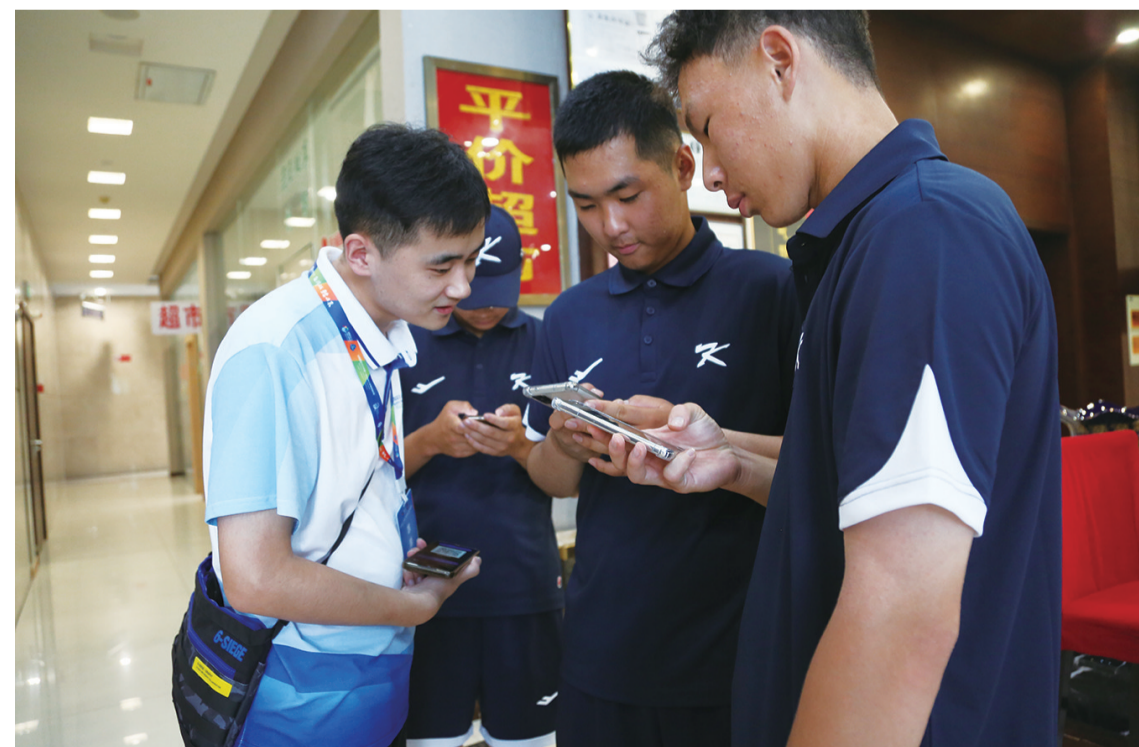
志愿者正在帮助运动员办理入住手续。

本报讯(记者 刘鹏雪)2023年第11届亚洲青少年棒球锦标赛(U15组)于8月20日晚在临港威海蓝鲸棒球场鸣锣开赛,8月18日,除了在训练一段时间的中国队外,其他7支参赛队陆续抵达临港。