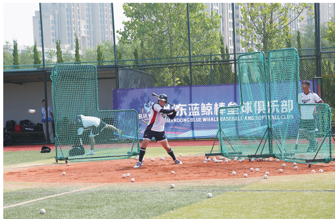
运动员正在进行击球训练。本报记者 刘鹏雪 摄